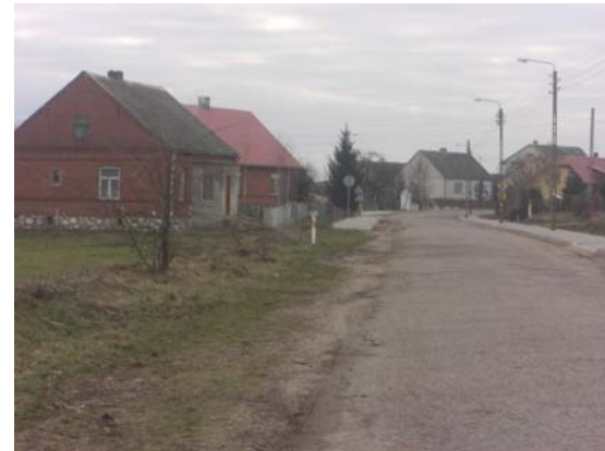
Mścichy, moje miejsce na Ziemi

Mścichy, wieś w gminie Radziłów, w powiecie grajewskim. Wieś, jakich tysiące na Podlasiu, ani biedna, ani bogata, ze szkołą podstawową, dwoma sklepami i nowym kościółkiem.